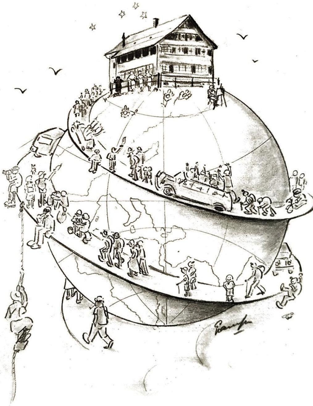
Original-Gästebucheintrag von 1952

Es hat zu oberst in der Welt Der Herr die Alp Scheidegg gestellt